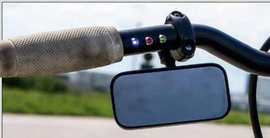
Saubere Sache: Die vom Gesetzgeber geforderten Kontrollleuchten sind links im Lenker platziert

des Tanks, mehr braucht's nicht. Die vom TÜV geforderten Kontrollleuchten sitzen links im Lenker, der ansonsten denkbar clean gehalten ist. Apropos cleaner Lenker: Einen Kupplungshebel sucht man dort vergeblich. Tom kuppelt per Fuß und schaltet mit einem Jockeyshift von Hand. So gehört das bei einem Baujahr 1953.