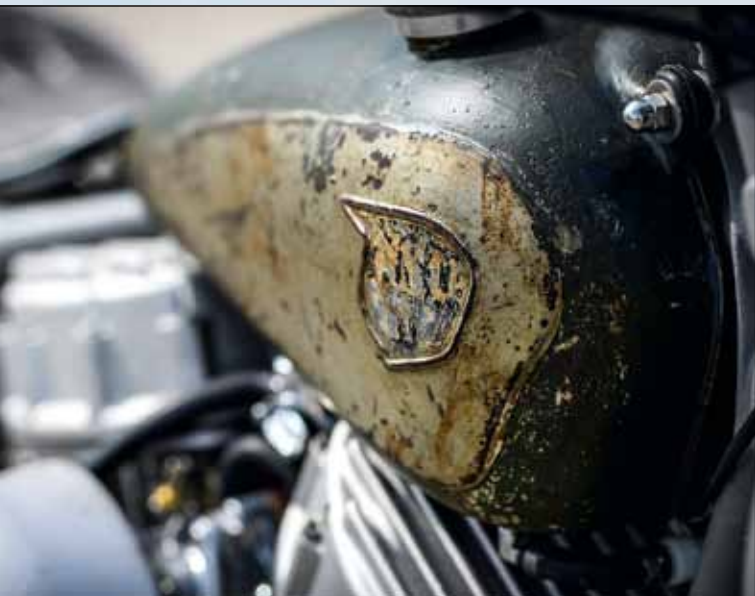
Originalzustand: Der komplett verwarzte Tank tat ehemals auf einer NSU aus den 60er Jahren Dienst