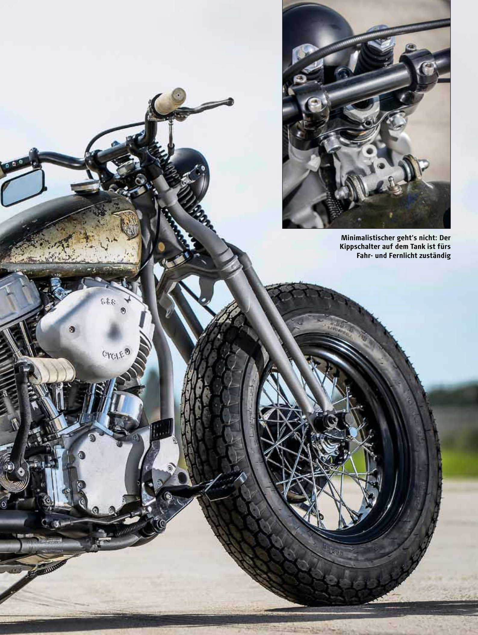
Minimalistischer geht's nicht: Der Kippschalter auf dem Tank ist fürs Fahr- und Fernlicht zuständig