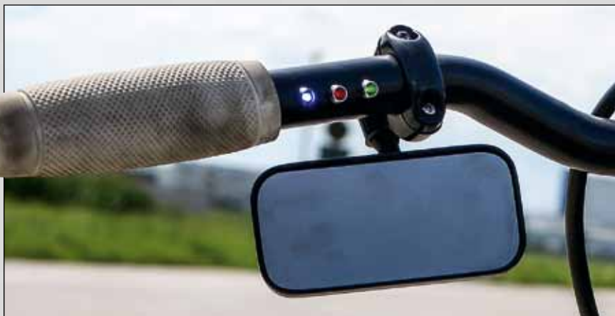
Saubere Sache: Die vom Gesetzgeber geforderten Kontrollleuchten sind links im Lenker platziert